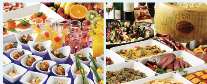
ランチブッフェのみのご利用もいただけます。詳細はHPをご覧ください

和食・洋食・中華からホテルメイドスイーツまで、シェフが腕によりをかけたお料理が約40種色鮮やかに並ぶランチブッフェ。中でも海の幸たっぷりの鉄板焼きとローストビーフが味わえるライブキッチンが大人気！開放的な露天風呂では四季の移り変わりを堪能でき、サウナも楽しめます。